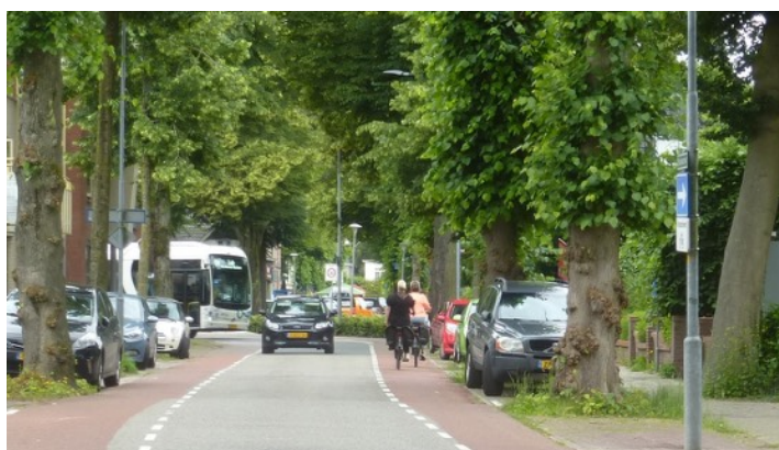
Ringweg Epe die ingericht gaat worden als 30 km weg

Die 3 kan de gemeente Epe wegwerken als de plannen om de ringweg in Epe en de Laan van Fasna in Vaassen tot 30 km-wegen om te vormen worden gerealiseerd. De scores van de gemeente Epe kun je zien door op deze link te klikken.